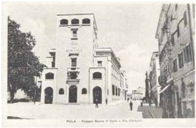
Pola all'epoca, la Banca d'Italia