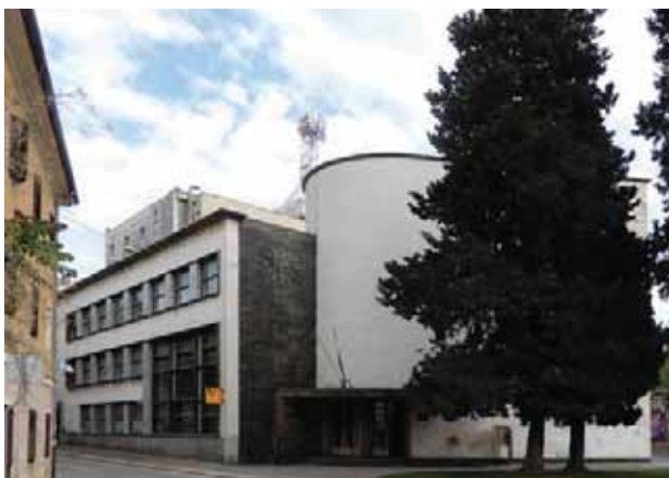
Palazzo delle Poste di Pola, oggi

Il Palazzo, nonostante diverse mutilazioni subite nel tempo, riguardanti soprattutto la facciata e in partico-