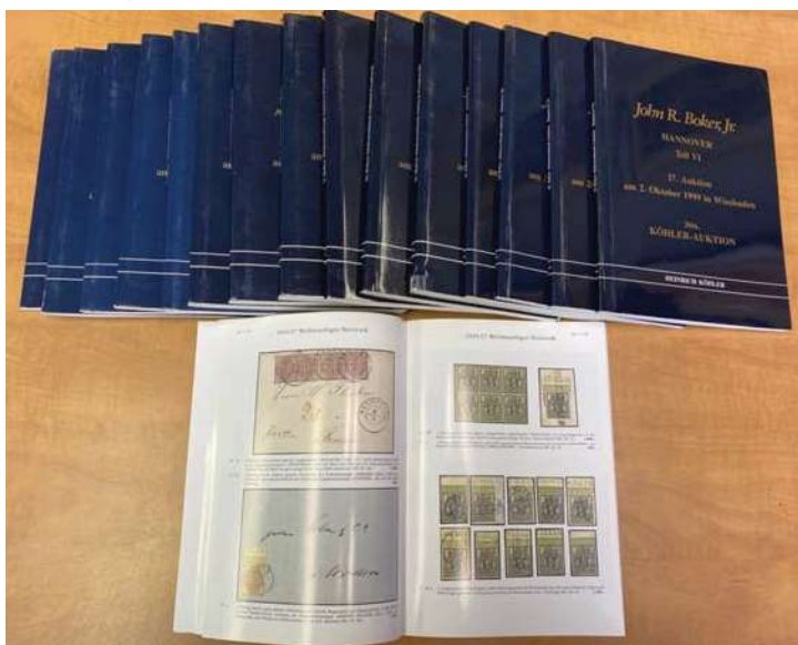
Cataloghi delle vendite

Insomma una serie di cataloghi d'asta che rappresentano per gli Antichi Stati Tedeschi un "must", un comprensivo manuale, testo di riferimento per tutti i collezionisti e commercianti di questi francobolli classici.