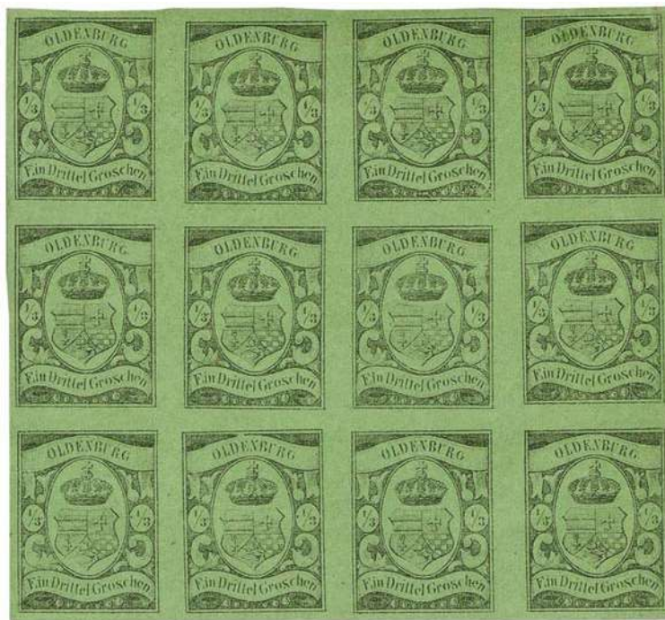
GERMAN STATES, Oldenburg 4

Dopo essersi laureato a Yale, nel 1943 Boker prestò servizio durante la seconda guerra mondiale nell'esercito americano come maggiore di fan-