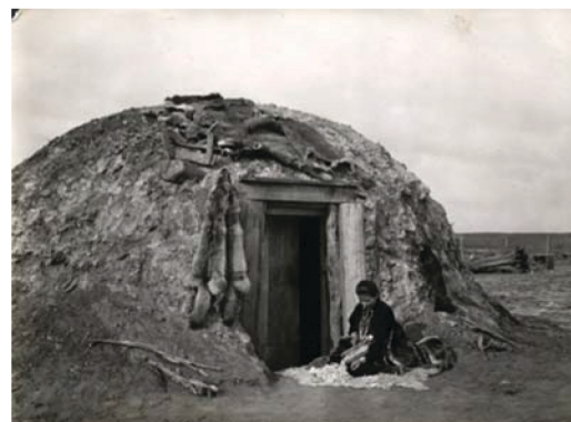
Abitazione Navajo di fine 800

Nella loro cultura la partecipazione alla guerra o a un combattimento non era intesa come sinonimo di valore, di coraggio o di vicinanza al divino, come era prerogativa del popolo dei Lakota, nativo delle pianure, per il quale combattere era un atto quasi sacro. Per i Navajo, ma anche per gli Apache, il combattimento era finalizzato alla difesa