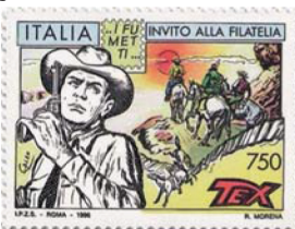
Tex su un 750 lire italiano del 1996 disegnato dal suo primo illustratore Aurelio Galleppini (Unif. n. 2280)

dalle rappresaglie di chi reagiva alle loro razzie. Questo popolo combatté a lungo contro l'esercito degli Stati Uniti, che ufficialmente interveniva a difesa degli interessi degli allevatori e degli agricoltori bianchi, ma in realtà agiva per eliminare la scomoda presenza dei nativi, in quanto si credeva che nei territori Navajo vi fossero miniere d'oro e d'argento. Essendo i Navajo divisi in svariati gruppi dispersi in vasti territori, la lotta fu lunga e difficile e si concluse alla fine del 1864, con la guerra di secessione ancora in corso. Il conflitto provocò la morte di circa mille Navajo sul campo, ma molte altre vittime ci furono fra gli 8.000 prigionieri che vennero costretti a marciare per quasi 500 chilometri fino al territorio di Bosque Redondo, che divenne la loro prigione a cielo aperto in una zona malsana, soggetta a ripetute inondazioni, inadatta alla coltivazione e quindi all'autosufficienza alimentare dei prigionieri. La scarsità di ap-