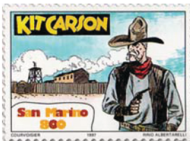
Kit Carson, l'intramontabile pard (socio) di Tex sull'800 lire di San Marino del 1997 (Unif. n. 1577).