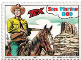
800 lire di San Marino del 1997 (Unif. n. 1579)